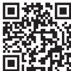
Harmadik féltől származó hangvezérlés