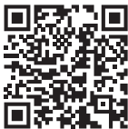
Steuerung der Smartphone-App (WL-Box1 video)